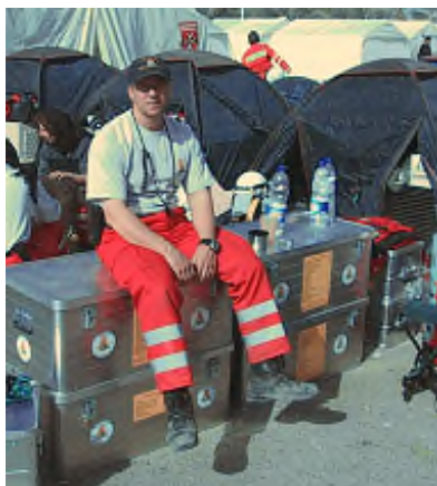
Im Camp der Hilfsorganisationen kurz vor der Heimreise

Wie gestaltet sich die Zusammenarbeit mit den vielen internationalen Organisationen, mit denen man in einem Erdbebengebiet zu tun hat?